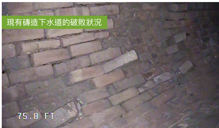
現有磚造下水道的破敗狀況

本項目屬於污水系統改善計劃投資一環，主要是修復位於 New Montgomery Street (介於Market 和 Howard Street 之間) 以及 Jessie、Minna 和米慎街Mission Street (介於 2nd 和3rd Street 之間) 下方，具有百年歷史的現有下水道總管。為了儘量減少道路及周邊住宅和商戶所受到的影響，大部分下水道修復作業將採用一種名為「原位固化法」(Cured-In-Place-Pipe, CIPP) 的免開挖施工法 (詳見 sfpuc.org/curedpipe )。施工將包括項目範圍內的下水道下支渠改良工程。部分地點需要挖掘路面，屆時將提前發送通知。