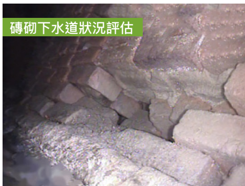
磚砌下水道狀況評估

此外，SFPUC還與另一個城市機構——三藩市市政運輸局(SFMTA)進行了協調，並加入了交通改善措施，例如在Mission街和20街交叉口附近的公交站更換和相關人行道及交通信號燈工程，這些工程將與下水道施工合同一起完成。交通運輸相關工程由SFMTA提議，公交站更換項目的相關信息可在SFMTA網站上獲取，或致電以下聯絡電話查詢。