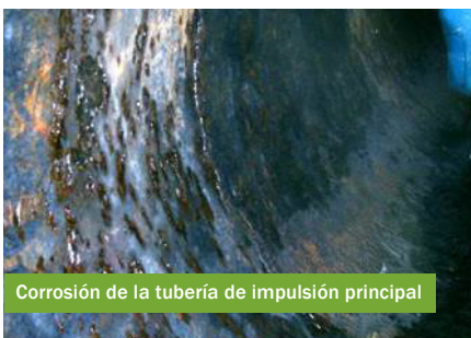
Corrosión de la tubería de impulsión principal

Para proteger la salud pública y el medio ambiente, la SFPUC rehabilitará esta sección crítica de nuestro sistema de alcantarillado. Al finalizar este proyecto, toda la porción de la tubería afuera del tanque de transporte y almacenamiento de Jackson Street tendrá un sistema adicional completo para que no se interrumpa el servicio ni haya desbordamientos de aguas residuales en la Bahía.