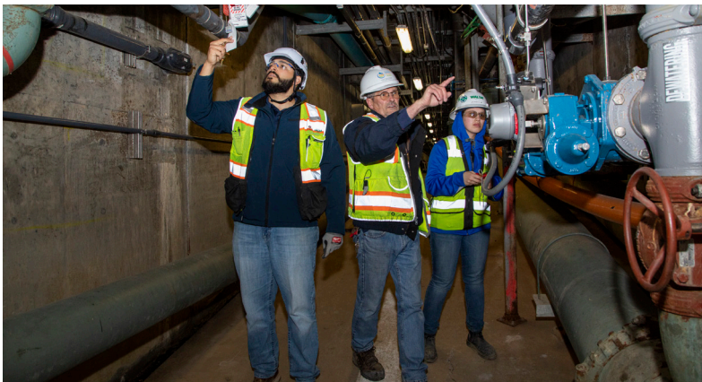
Las cuadrillas se toman un breve descanso mientras se preparan para elevar una tapa de acero de 60,000 libras y colocarla en el digestor de biosólidos.