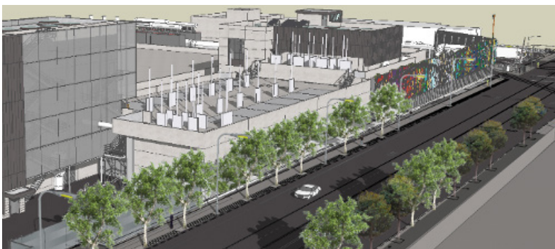
Una representación de la restauración de Evans Avenue, mirando hacia Rankin Street, incluida la restauración de aceras y bordillos, así como la instalación de farolas y plantación de árboles.