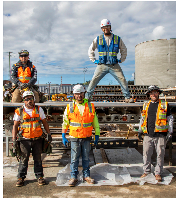
Las cuadrillas se toman un breve descanso mientras se preparan para elevar una tapa de acero de 60,000 libras y colocarla en el digestor de biosólidos.