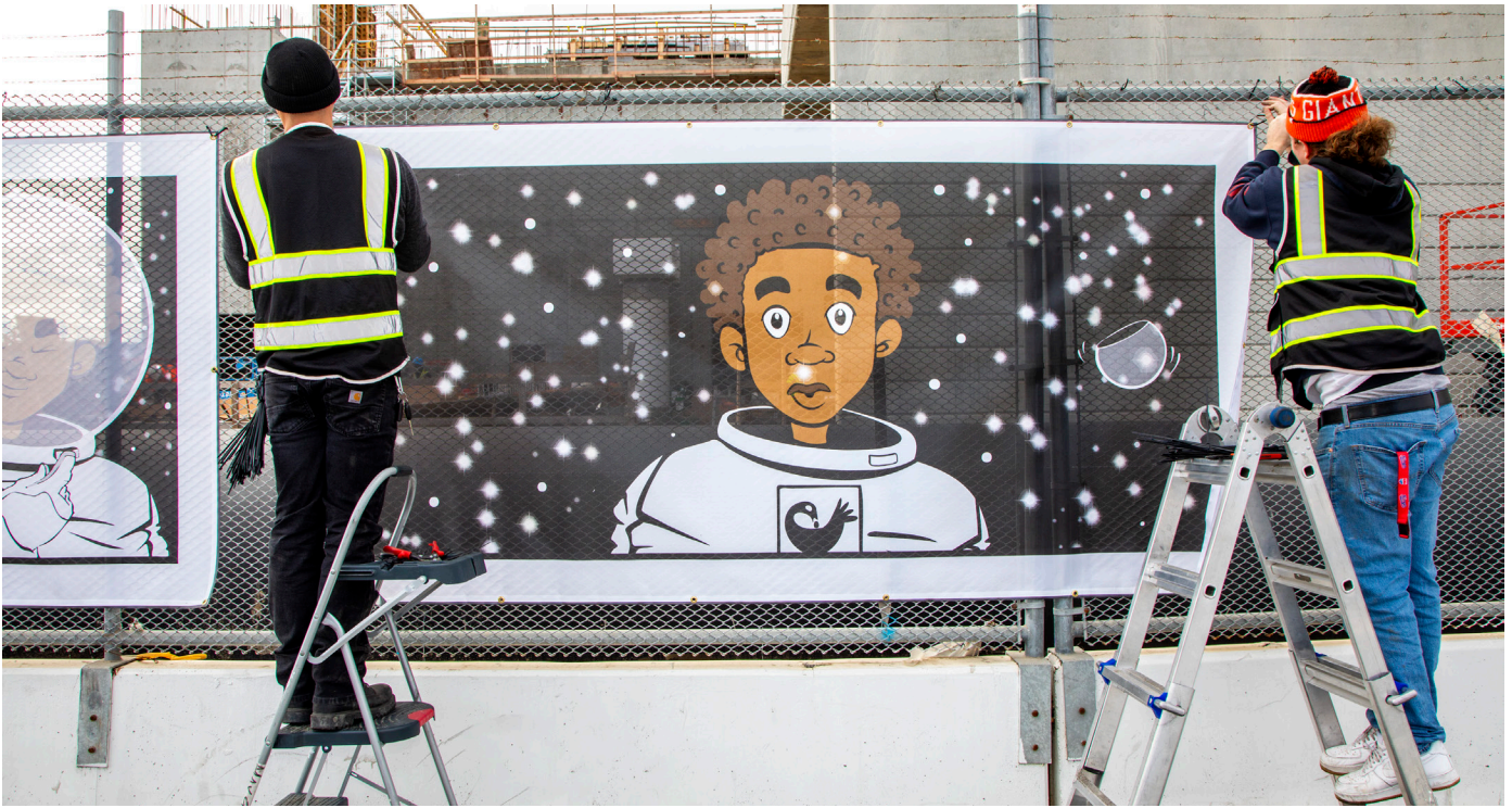
El mural temporal, "Jamari's Journey", por la artista e ilustradora local Nancy Cato, como se instaló en la valla de construcción a lo largo de Evans Avenue durante el año 2023.